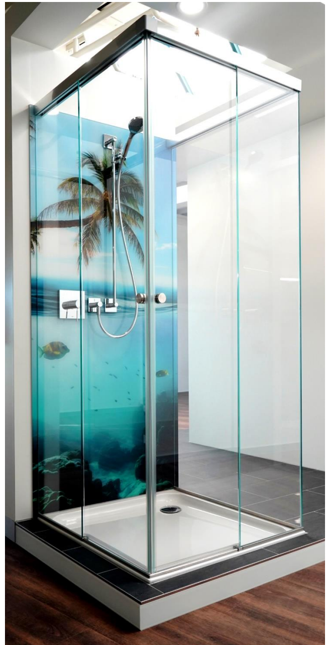
Individuelle Glasrückwand mit hochauflösendem Photoprint

Mit einem hochauflösenden Photoprint ist eine noch individuellere Gestaltung und jeder noch so spezifische Kundenwunsch realisierbar.