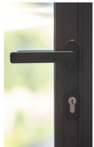
Schloss mit Türdrücker